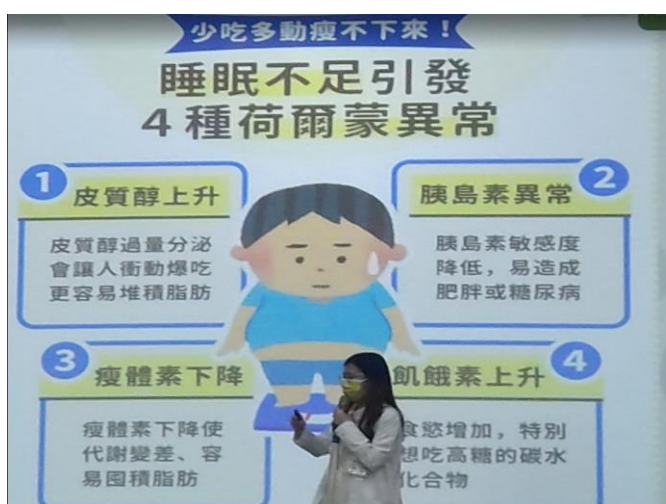
1130314健康體位保健講座