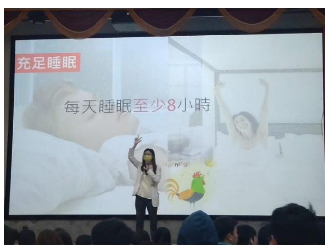
1130314健康體位保健講座