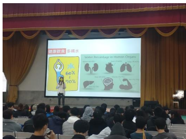
1130314健康體位保健講座