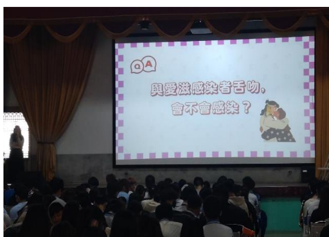
1130222性教育(含愛滋防治)講座